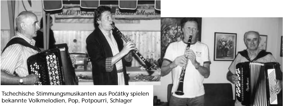
Tschechische Stimmungsmusikanten aus Počátky spielen bekannte Volksmelodien, Pop, Potpourri, Schlager